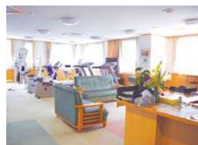
▲健康増進センター